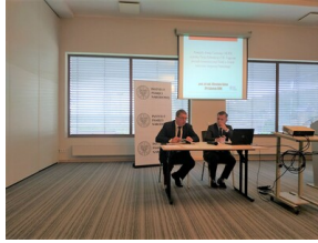
Ogólnopolska konferencja naukowa „Na wojnie z komunizmem. Literaci i pisarze polityczni wobec sowyetyzacji pojarckańskiej Polski” - Olsztyn, 28-29 wrzesnia 2022