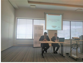
Ogólnopolska konferencja naukowa „Na wojnie z komunizmem. Literaci i pisarze polityczni wobec sowyetyzacji pojarckańskiej Polski” - Olsztyn, 28-29 wrzesnia 2022