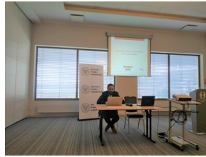
Ogólnopolska konferencja naukowa „Na wojnie z komunizmem. Literaci i pisarze polityczni wobec sowyetyzacji pojarckańskiej Polski” - Olsztyn, 28-29 wrzesnia 2022