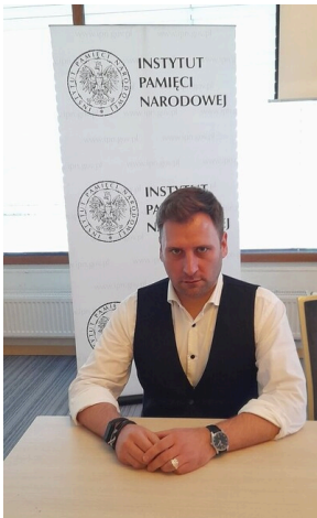
Ogólnopolska konferencja naukowa „Na wojnie z komunizmem. Literaci i pisarze polityczni wobec sowyetyzacji pojarckańskiej Polski” - Olsztyn, 28-29 wrzesnia 2022