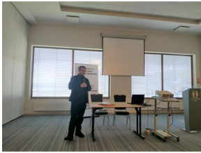
Ogólnopolska konferencja naukowa „Na wojnie z komunizmem. Literaci i pisarze polityczni wobec sowyetyzacji pojarckańskiej Polski” - Olsztyn, 28-29 wrzesnia 2022