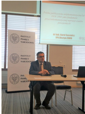
Ogólnopolska konferencja naukowa „Na wojnie z komunizmem. Literaci i pisarze polityczni wobec sowyetyzacji pojarckańskiej Polski” - Olsztyn, 28-29 wrzesnia 2022