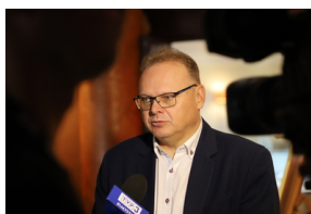
Konferencja naukowa „Wygnańcy, tułacze – trudne powroty 1944-1989” – Białystok, 25 października 2022,