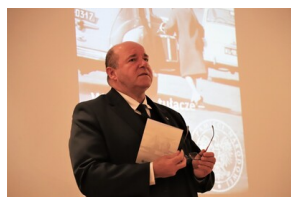
Konferencja naukowa „Wygnańcy, tułacze – trudne powroty 1944-1989” – Białystok, 25 października 2022,