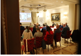
Fot. Natalia Krzywicka IPN