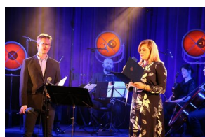
III Edycja Konkursu Poetyckiego „Historia najnowsza Polski w poezji dzieci i młodzieży”

https://www.facebook.com/IPN.Bialystok/posts/2724488797818191