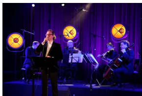
III Edycja Konkursu Poetyckiego „Historia najnowsza Polski w poezji dzieci i młodzieży”, fot. Patrycja Leszczyńska, Jolanta Brzozowska IPN