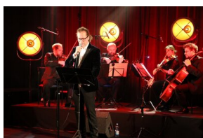
III Edycja Konkursu Poetyckiego „Historia najnowsza Polski w poezji dzieci i młodzieży”, fot. Patrycja Leszczyńska, Jolanta Brzozowska IPN