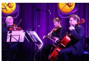
III Edycja Konkursu Poetyckiego „Historia najnowsza Polski w poezji dzieci i młodzieży”