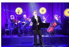
III Edycja Konkursu Poetyckiego „Historia najnowsza Polski w poezji dzieci i młodzieży”