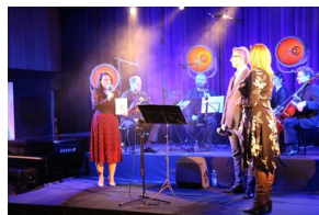
III Edycja Konkursu Poetyckiego „Historia najnowsza Polski w poezji dzieci i młodzieży”