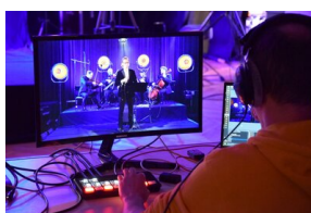
III Edycja Konkursu Poetyckiego „Historia najnowsza Polski w poezji dzieci i młodzieży”