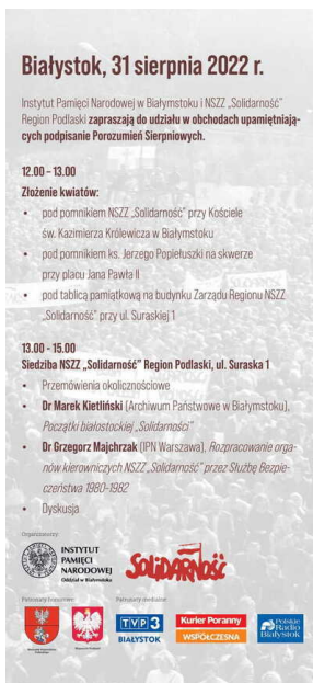
Zapowiedź obchodów 42. rocznicy podpisania porozumień sierpniowych - Białystok, 31 sierpnia 2022