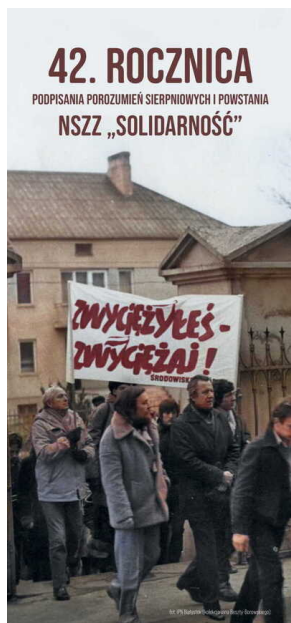
Zapowiedź obchodów 42. rocznicy podpisania porozumień sierpniowych - Białystok, 31 sierpnia 2022