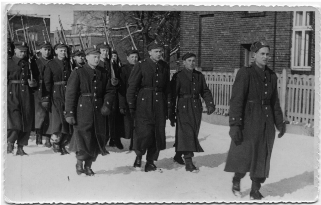
8 pluton podczas musztry z bronią Bi_755_3_031 (repozytorium cyfrowe)