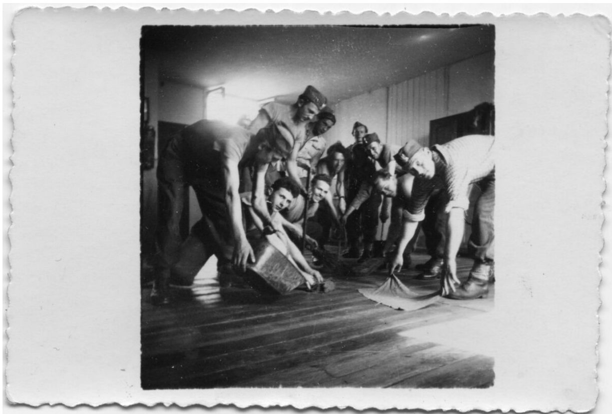
10 sprzątanie sali żołnierskiej Bi_755_3_0011 (repozytorium cyfrowe)