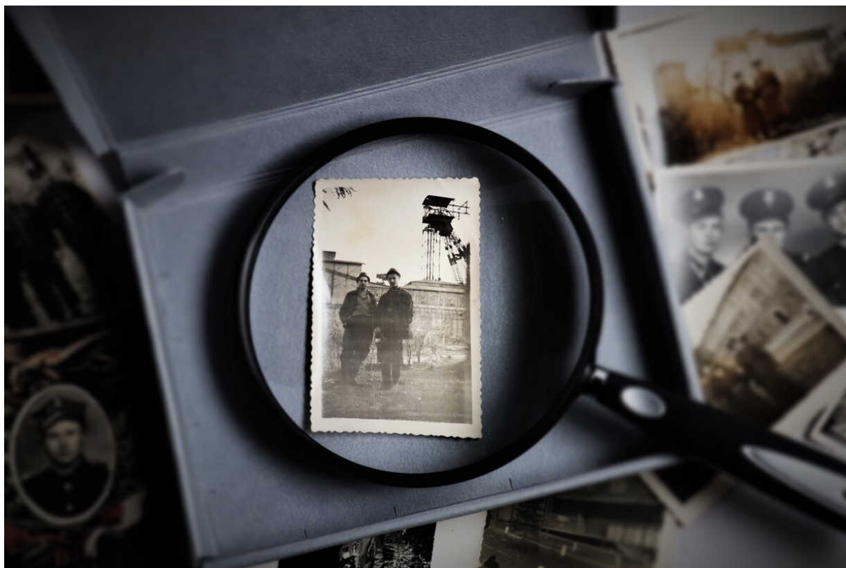
6 w tle szyb kopalni Jowisz 1956 r.IMG_3437