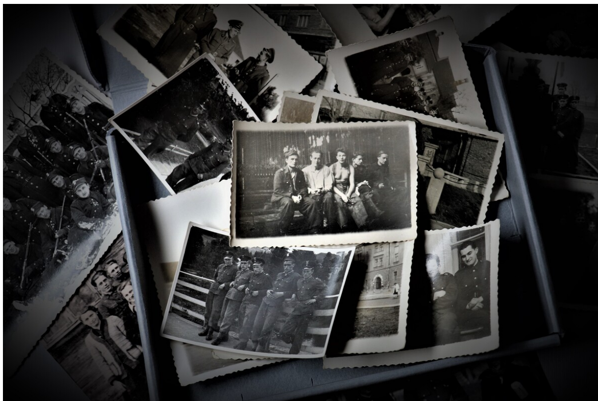
4 żołnierze-górnicy w przebieraalni kańcuchowej 1956 r.IMG_3325