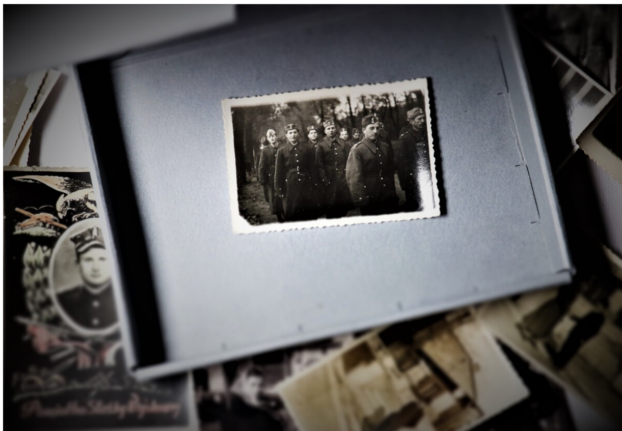
2 pluton w drodze do pracy w kopalni Jowisz, JW 2737, Wojkowice Komorne 1956 r.IMG_3365