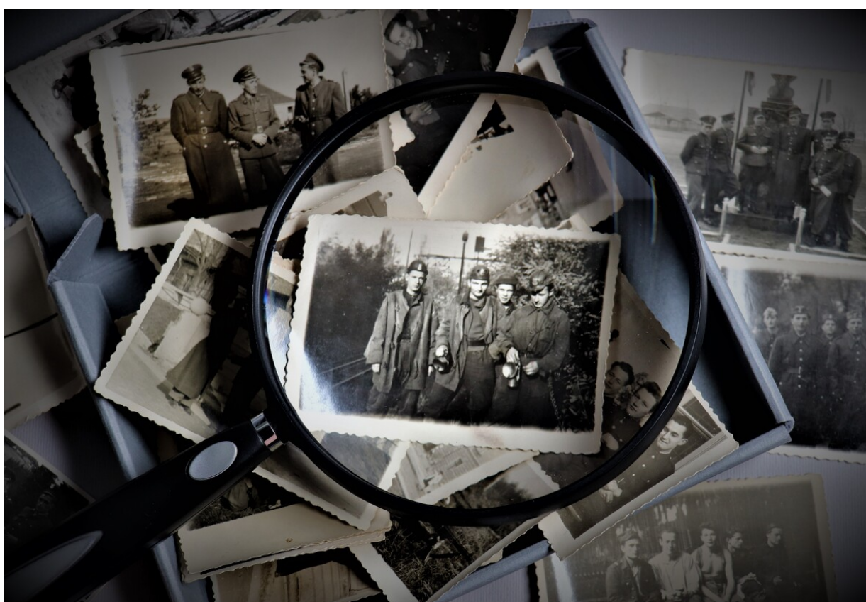
3 żołnierze-górnicy przed zjazdem do pracy w kopalni Jowisz 1956 r.IMG_3315