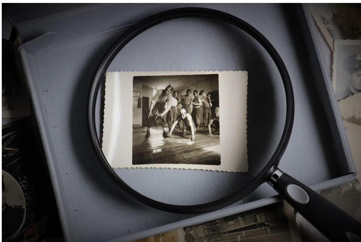
11 sprzątanie sali żołnierskiej Bi_755_3_0011