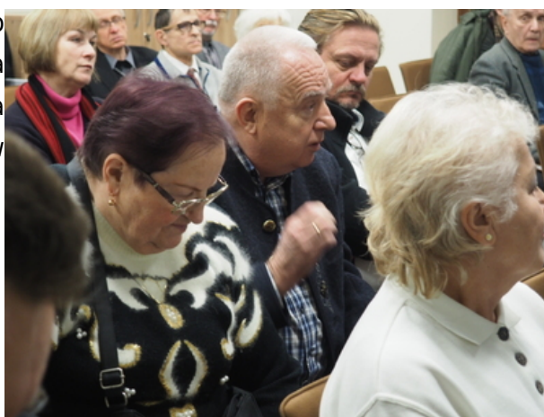
Po prezentacji książki dyskutowano o hipotezach dotyczących miejsca dokonania zbrodni przez sowieców