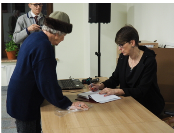
Na koniec Autorka podpisywała książkę