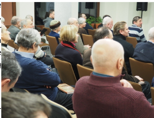
Na spotkanie przybyło kilkadziesiąt osób zainteresowanych tematem Obławy Augustowskiej