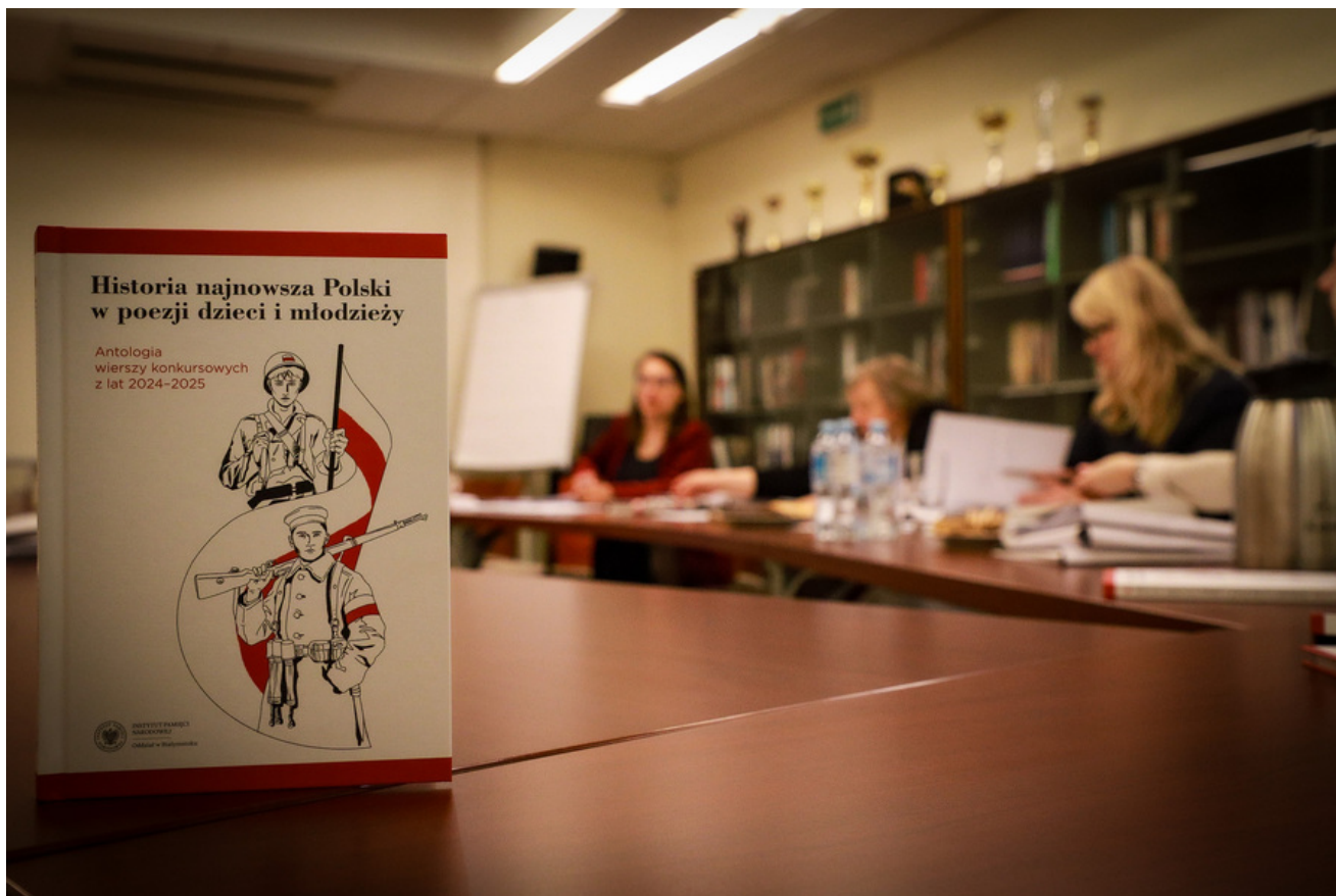
Wyniki IX edycji konkursu poetyckiego „Historia najnowsza Polski w poezji dzieci i młodzieży” – 8 czerwca 2026