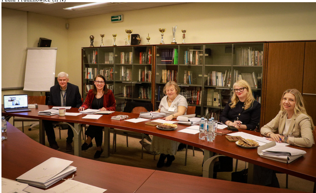
Wyniki IX edycji konkursu poetyckiego „Historia najnowsza Polski w poezji dzieci i młodzieży” – 8 czerwca 2026

Przypominamy, że zadaniem uczestników konkursu było przygotowanie własnego utworu poetyckiego, który powinien odnosić się do wartości patriotycznych lub upamiętniać wydarzenie, miejsce, osobę, symbol itp. z najnowszej historii Polski z lat 1918-1989 na podstawie dowolnie wybranego źródła historycznego, które stało się inspiracją do powstania utworu.