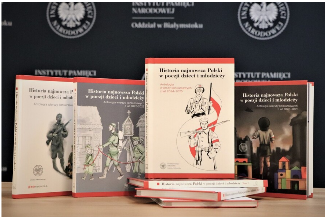
Wyniki IX edycji konkursu poetyckiego „Historia najnowsza Polski w poezji dzieci i młodzieży” – 8 czerwca 2026