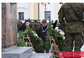
Białystok świętuje 105. rocznicę odzyskania niepodległości - Białystok, 19 luty 2024