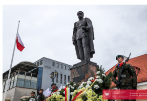
Białystok świętuje 105. rocznicę odzyskania niepodległości - Białystok, 19 luty 2024