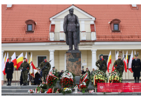
Białystok świętuje 105. rocznicę odzyskania niepodległości - Białystok, 19 luty 2024