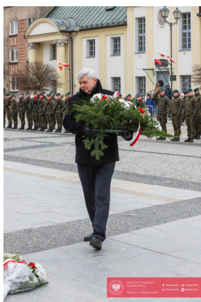
Białystok świętuje 105. rocznicę odzyskania niepodległości - Białystok, 19 luty 2024