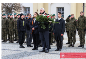
Białystok świętuje 105. rocznicę odzyskania niepodległości - Białystok, 19 luty 2024, fot.: C. Rutkowski