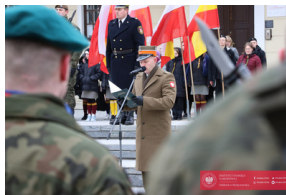
Białystok świętuje 105.