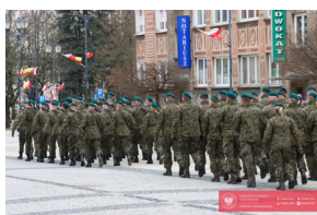
Białystok świętuje 105. rocznicę odzyskania niepodległości - Białystok, 19 luty 2024