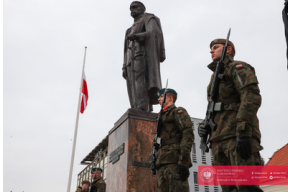
Białystok świętuje 105. rocznicę odzyskania niepodległości - Białystok, 19 lutego 2024