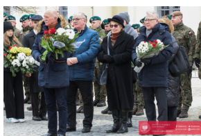
Białystok świętuje 105. rocznicę odzyskania niepodległości - Białystok, 19 luty 2024