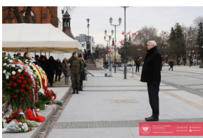
Białystok świętuje 105. rocznicę odzyskania niepodległości - Białystok, 19 luty 2024