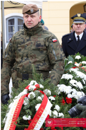
Białystok świętuje 105. rocznicę odzyskania niepodległości - Białystok, 19 lutego 2024