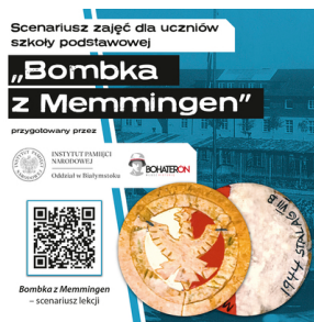
Słuchowisko „Bombka z Memmingen”