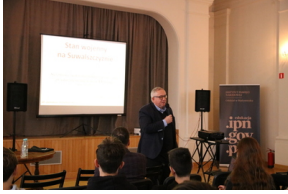
Przystanek Historia IPN pt. „Stan wojenny na Białostocczyźnie”