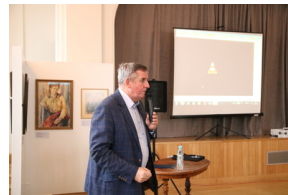
Przystanek Historia IPN pt. „Stan wojenny na Białostocczyźnie”