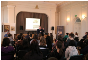
Przystanek Historia IPN pt. „Stan wojenny na Białostocczyźnie”