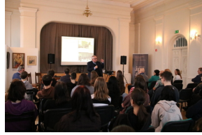
Przystanek Historia IPN pt. „Stan wojenny na Białostocczyźnie”