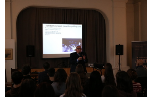
Przystanek Historia IPN pt. „Stan wojenny na Białostocczyźnie”