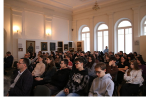
Przystanek Historia IPN pt. „Stan wojenny na Białostocczyźnie”