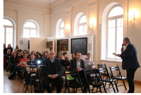
Przystanek Historia IPN pt. „Stan wojenny na Białostocczyźnie”