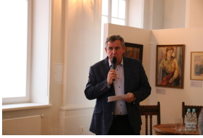
Przystanek Historia IPN pt. „Stan wojenny na Białostocczyźnie”