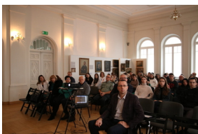
Przystanek Historia IPN pt. „Stan wojenny na Białostocczyźnie”