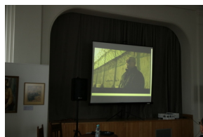
Przystanek Historia IPN pt. „Stan wojenny na Białostocczyźnie”