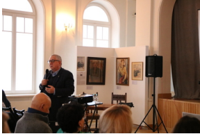
Przystanek Historia IPN pt. „Stan wojenny na Białostocczyźnie”