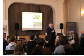
Przystanek Historia IPN pt. „Stan wojenny na Białostocczyźnie”