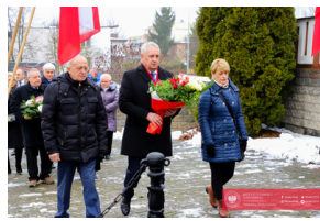
Obchody 42. Rocznicy wprowadzenia stanu wojennego - Biarystok, 13 grudnia 2023