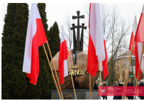
Obchody 42. Rocznicy wprowadzenia stanu wojennego - Biarystok, 13 grudnia 2023

Narodowego za „nielegalną grupę przestępczą o charakterze zbrojnym”. Jego sprawcy nie ponieśli odpowiedzialności karnej.