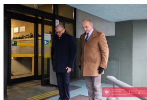
Obchody 42. Rocznicy wprowadzenia stanu wojennego - Biarystok, 13 grudnia 2023