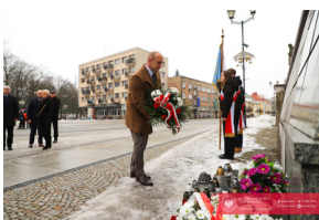
Obchody 42. Rocznicy wprowadzenia stanu wojennego - Biarystok, 13 grudnia 2023