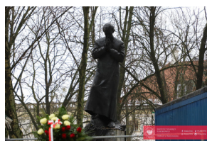
Obchody 42. Rocznicy wprowadzenia stanu wojennego - Biarystok, 13 grudnia 2023