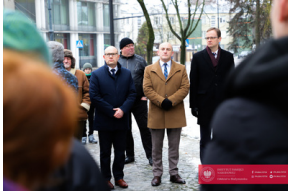
Obchody 42. Rocznicy wprowadzenia stanu wojennego - Białystok, 13 grudnia 2023