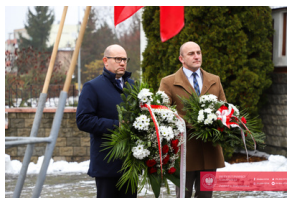
Obchody 42. Rocznicy wprowadzenia stanu wojennego - Biarystok, 13 grudnia 2023