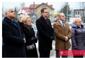
Obchody 42. Rocznicy wprowadzenia stanu wojennego - Biarystok, 13 grudnia 2023