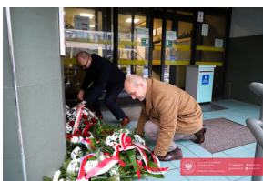
Obchody 42. Rocznicy wprowadzenia stanu wojennego - Biarystok, 13 grudnia 2023