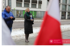
Obchody 42. Rocznicy wprowadzenia stanu wojennego - Białystok, 13 grudnia 2023, fot. C. Rutkowski