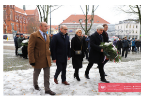
Obchody 42. Rocznicy wprowadzenia stanu wojennego - Biarystok, 13 grudnia 2023