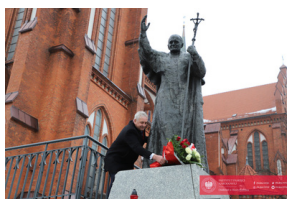
Obchody 42. Rocznicy wprowadzenia stanu wojennego - Biarystok, 13 grudnia 2023, fot. C. Rutkowski