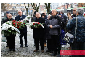
Obchody 42. Rocznicy wprowadzenia stanu wojennego - Biarystok, 13 grudnia 2023