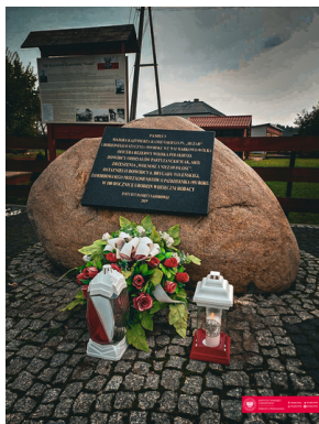
70. rocznica zamordowania dowódcy podziemia niepodległościowego - "Huzara".