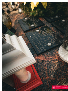
70. rocznica zamordowania dowódcy podziemia niepodległościowego - "Huzara".