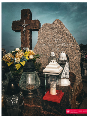
70. rocznica zamordowania dowódcy podziemia niepodległościowego - "Huzara".