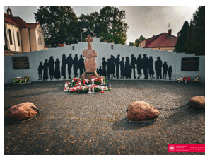
70. rocznica zamordowania dowódcy podziemia niepodległościowego - "Huzara".