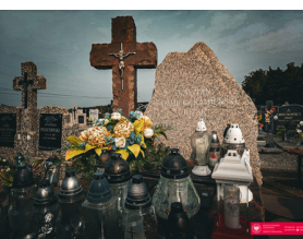
70. rocznica zamordowania dowódcy podziemia niepodległościowego - "Huzara".