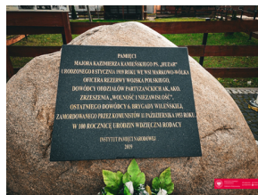
70. rocznica zamordowania dowódcy podziemia niepodległościowego - "Huzara".