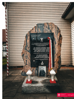
70. rocznica zamordowania dowódcy podziemia niepodległościowego - "Huzara".