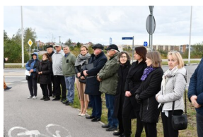
Odsłonięcie tablicy informacyjno-historycznej