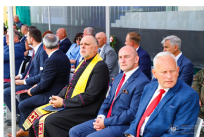
Dzień Pamięci Ofiar Obławy Augustowskiej - Giby, Augustów, 12 lipca 2023 r.