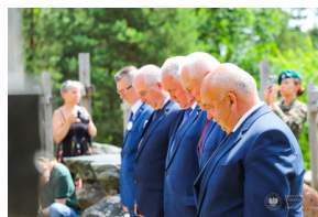
Dzień Pamięci Ofiar Obiawy Augustowskiej -