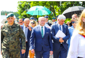
Dzień Pamięci Ofiar Obiawy Augustowskiej - Giby, Augustów, 12 lipca 2023 r., fot. Paweł Bezubik