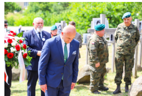
Dzień Pamięci Ofiar Obiawy Augustowskiej - Giby, Augustów, 12 lipca 2023 r.