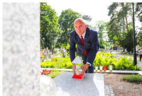
Dzień Pamięci Ofiar Obławy Augustowskiej - Giby, Augustów, 12 lipca 2023 r.