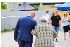
Dzień Pamięci Ofiar Obławy Augustowskiej - Giby, Augustów, 12 lipca 2023 r., fot. Paweł Bezubik