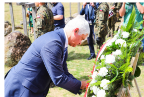
Dzień Pamięci Ofiar Obiawy Augustowskiej - Giby, Augustów, 12 lipca 2023 r.