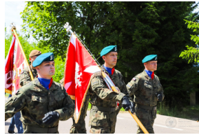
Dzień Pamięci Ofiar Obiawy Augustowskiej - Giby, Augustów, 12 lipca 2023 r.