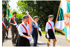
Dzień Pamięci Ofiar Obiawy Augustowskiej - Giby, Augustów, 12 lipca 2023 r.