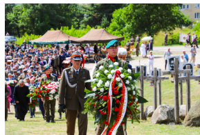
Dzień Pamięci Ofiar Obiawy Augustowskiej - Giby, Augustów, 12 lipca 2023 r.