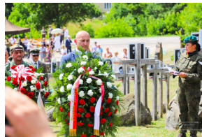
Dzień Pamięci Ofiar Obiawy Augustowskiej - Giby, Augustów, 12 lipca 2023 r.