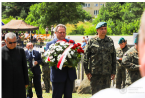
Dzień Pamięci Ofiar Obiawy Augustowskiej - Giby, Augustów, 12 lipca 2023 r.