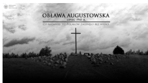
Dzień Pamięci Ofiar Obławy Augustowskiej 2023 r.

12 lipca 2023 r. w Gibach odbyły się uroczyste obchody 78. rocznicy Obławy Augustowskiej z lipca 1945 r. – największej sowieckiej zbrodni dokonanej na Polakach po II wojnie światowej. Obchody rozpoczął przemarsz spod kościoła pw. Św. Anny w Gibach pod Krzyż - pomnik Ofiar Obławy Augustowskiej, gdzie delegacje oraz organizatorzy oddali hołd pomordowanym.