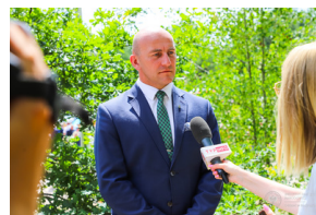
Dzień Pamięci Ofiar Obiawy Augustowskiej -