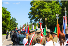
Dzień Pamięci Ofiar Obiawy Augustowskiej - Giby, Augustów, 12 lipca 2023 r.