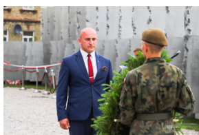
Dzień Pamięci Ofiar Obławy Augustowskiej - Giby, Augustów, 12 lipca 2023 r.