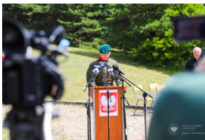
Dzień Pamięci Ofiar Obiawy Augustowskiej - Giby, Augustów, 12 lipca 2023 r.