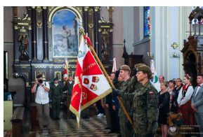
Dzień Pamięci Ofiar Obławy Augustowskiej - Giby, Augustów, 12 lipca 2023 r.