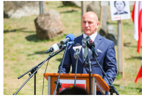
Dzień Pamięci Ofiar Obiawy Augustowskiej - Giby, Augustów, 12 lipca 2023 r.