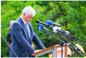
Dzień Pamięci Ofiar Obiawy Augustowskiej - Giby, Augustów, 12 lipca 2023 r.