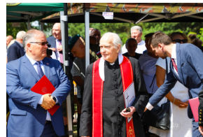
Dzień Pamięci Ofiar Obiawy Augustowskiej - Giby, Augustów, 12 lipca 2023 r.