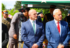
Dzień Pamięci Ofiar Obiawy Augustowskiej - Giby, Augustów, 12 lipca 2023 r.