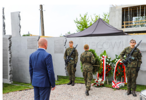
Dzień Pamięci Ofiar Obławy Augustowskiej - Giby, Augustów, 12 lipca 2023 r.