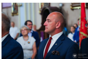
Dzień Pamięci Ofiar Obławy Augustowskiej - Giby, Augustów, 12 lipca 2023 r.