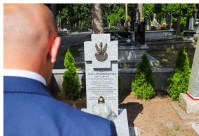
Dzień Pamięci Ofiar Obławy Augustowskiej - Giby, Augustów, 12 lipca 2023 r.