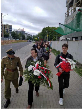
80. rocznica śmierci ppor. Jadwigi Dziekońskiej ps. "Jadzia" - Białystok, 19 maja 2023, fot. Zespół Szkoły Technicznych im. gen. Władysława Andersa