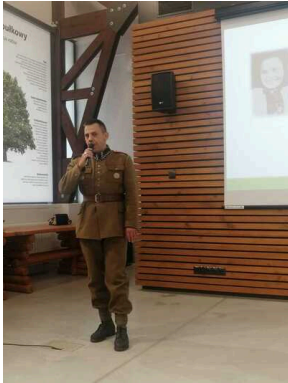
Szkół Technicznych im. gen. Władysława Andersa