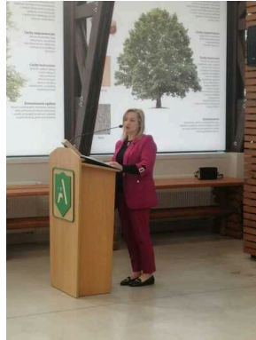
Szkół Technicznych im. gen. Władysława Andersa