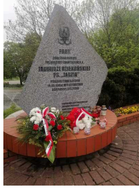
80. rocznica śmierci ppor. Jadwigi Dziekońskiej ps. "Jadzia" - Białystok, 19 maja 2023, fot. Zespół Szkoły Technicznych im. gen. Władysława Andersa