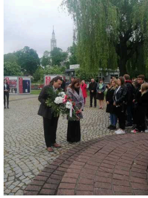
80. rocznica śmierci ppor. Jadwigi Dziekońskiej ps. "Jadzia" - Białystok, 19 maja 2023