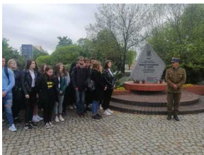
80. rocznica śmierci ppor. Jadwigi Dziekońskiej ps. "Jadzia" - Białystok, 19 maja 2023