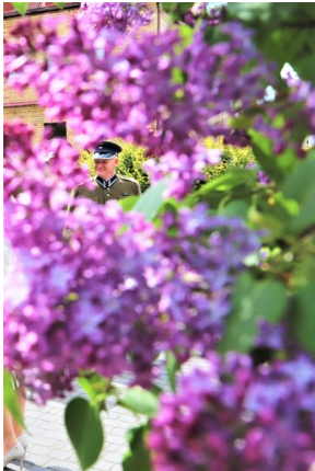
Święto 10. Pułku Ułanów Litewskich - Białystok, 13 maja 2023