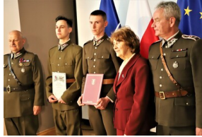
Święto 10. Pułku Ułanów Litewskich - Białystok, 13 maja 2023, fot. Natalia Krzywicka IPN