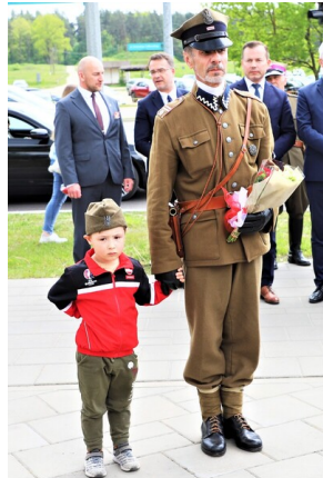
Święto 10. Pułku Ułanów Litewskich - Białystok, 13 maja 2023