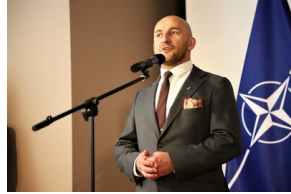
Święto 10. Pułku Ułanów Litewskich - Białystok, 13 maja 2023