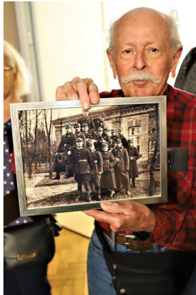
Święto 10. Pułku Ułanów Litewskich - Białystok, 13 maja 2023