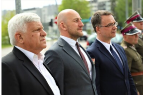
Święto 10. Pułku Ułanów Litewskich - Białystok, 13 maja 2023