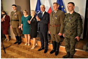
Święto 10. Pułku Ułanów Litewskich - Białystok, 13 maja 2023