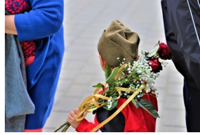
Święto 10. Pułku Ułanów Litewskich - Białystok, 13 maja 2023