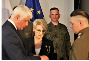
Święto 10. Pułku Ułanów Litewskich - Białystok, 13 maja 2023