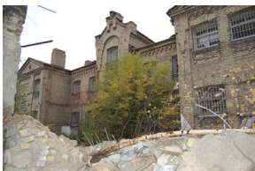
Więzienie karno-śledcze (1944-1956) - Suwałki - Śladami zbrodni

Oddział Instytutu Pamięi Narodowej w Białymstoku