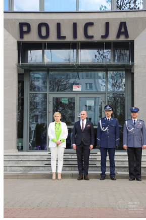
Obchody Dnia Pamięci Ofiar Zbrodni Katyńskiej - Grajewo, 12 kwietnia 2023