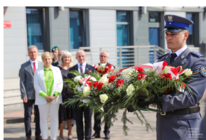
Odstąpienie pomnika w Grajewie, 12.04.2023