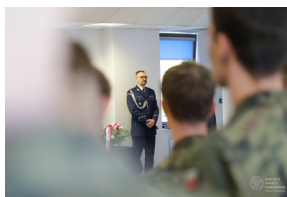
Obchody Dnia Pamięci Ofiar Zbrodni Katyńskiej - Grajewo, 12 kwietnia 2023