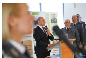
Odstąpienie pomnika w Grajewie, 12.04.2023