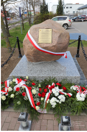
Obchody Dnia Pamięci Ofiar Zbrodni Katyńskiej - Grajewo, 12 kwietnia 2023