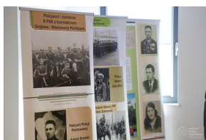
Odstąpienie pomnika w Grajewie, 12.04.2023