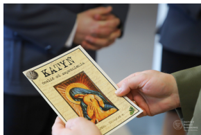
Obchody Dnia Pamięci Ofiar Zbrodni Katyńskiej - Grajewo, 12 kwietnia 2023