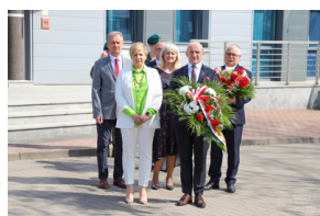
Odstąpienie pomnika w Grajewie, 12.04.2023