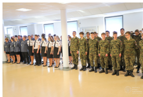
Odstąpienie pomnika w Grajewie, 12.04.2023