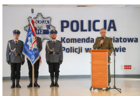
Odstąpienie pomnika w Grajewie, 12.04.2023