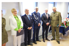
Odstąpienie pomnika w Grajewie, 12.04.2023