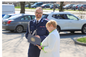
Odstąpienie pomnika w Grajewie, 12.04.2023