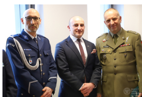
Odstąpienie pomnika w Grajewie, 12.04.2023