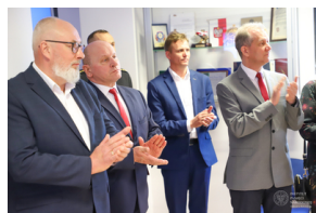
Odstąpienie pomnika w Grajewie, 12.04.2023