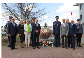
Obchody Dnia Pamięci Ofiar Zbrodni Katyńskiej - Grajewo, 12 kwietnia 2023