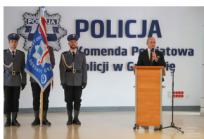
Odstąpienie pomnika w Grajewie, 12.04.2023