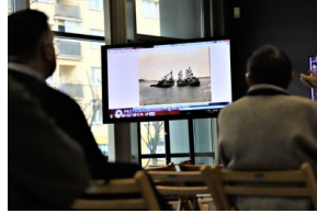
"Przystanek Historia" o Flotylli Pińskiej - Białystok, 28 marca 2023, Fot. Natalia Krzywicka IPN