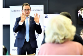
"Przystanek Historia" o Flotylli Pińskiej - Białystok, 28 marca 2023, Fot. Natalia Krzywicka IPN