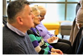
"Przystanek Historia" o Flotylli Pińskiej - Białystok, 28 marca 2023, Fot. Natalia Krzywicka IPN