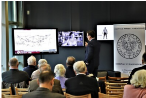
"Przystanek Historia" o Flotylli Pińskiej - Białystok, 28 marca 2023, Fot. Natalia Krzywicka IPN