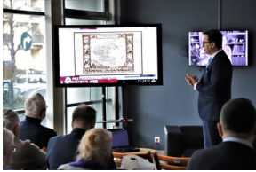
"Przystanek Historia" o Flotylli Pińskiej - Białystok, 28 marca 2023