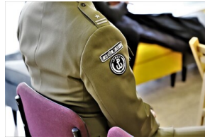
"Przystanek Historia" o Flotylli Pińskiej - Białystok, 28 marca 2023, Fot. Natalia Krzywicka IPN