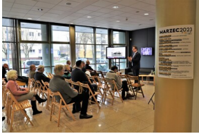
"Przystanek Historia" o Flotylli Pińskiej - Białystok, 28 marca 2023, Fot. Natalia Krzywicka IPN