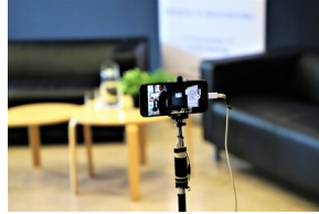
"Przystanek Historia" o Flotylli Pińskiej - Białystok, 28 marca 2023, Fot. Natalia Krzywicka IPN