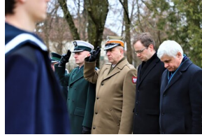
Narodowy Dzień Pamięci "Żołnierzy Wyklętych" - Białystok, 1 marca 2023