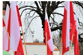
Narodowy Dzień Pamięci "Żołnierzy Wyklętych" - Białystok, 1 marca 2023