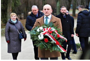
Narodowy Dzień Pamięci "Żołnierzy Wyklętych" - Białystok, 1 marca 2023, Fot. Natalia Krzywicka