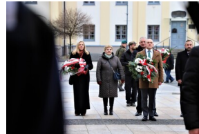
Narodowy Dzień Pamięci "Żołnierzy Wyklętych" - Białystok, 1 marca 2023