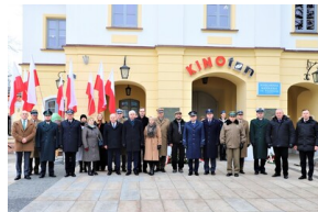
Narodowy Dzień Pamięci "Żołnierzy Wyklętych" - Białystok, 1 marca 2023