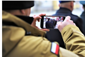
Narodowy Dzień Pamięci "Żołnierzy Wyklętych" - Białystok, 1 marca 2023