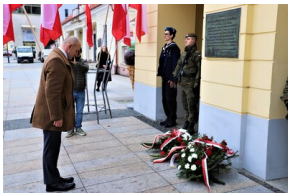
Narodowy Dzień Pamięci "Żołnierzy Wyklętych" - Białystok, 1 marca 2023, Fot. Natalia Krzywicka