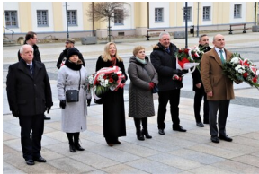
Narodowy Dzień Pamięci "Żołnierzy Wyklętych" - Białystok, 1 marca 2023, Fot. Natalia Krzywicka