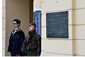
Narodowy Dzień Pamięci "Żołnierzy Wyklętych" - Białystok, 1 marca 2023