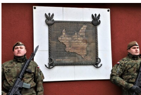
Narodowy Dzień Pamięci "Żołnierzy Wyklętych" - Białystok, 1 marca 2023