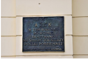
Narodowy Dzień Pamięci "Żołnierzy Wyklętych" - Białystok, 1 marca 2023