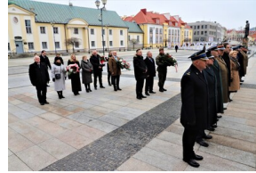
Narodowy Dzień Pamięci "Żołnierzy Wyklętych" - Białystok, 1 marca 2023