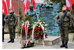
Narodowy Dzień Pamięci "Żołnierzy Wyklętych" - Białystok, 1 marca 2023, Fot. Natalia Krzywicka