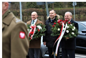
Narodowy Dzień Pamięci "Żołnierzy Wyklętych" - Białystok, 1 marca 2023, Fot. Natalia Krzywicka