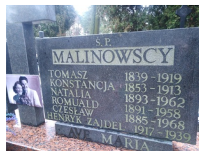
Pomnik Tomasza Malinowskiego obecnie