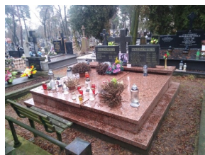
Pomnik Tomasza Malinowskiego obecnie