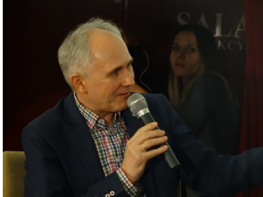
Prezentacja słuchowiska "Bombka z Memmingen" - Olsztyn, 9 stycznia 2023vvvv