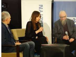
Prezentacja słuchowiska "Bombka z Memmingen" - Olsztyn, 9 stycznia 2023vvvv