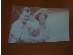
Prezentacja słuchowiska "Bombka z Memmingen" - Olsztyn, 9 stycznia 2023vvvv