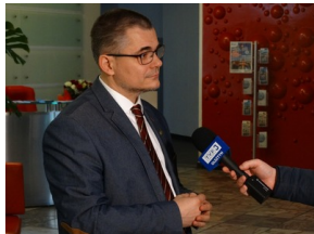
Prezentacja słuchowiska "Bombka z Memmingen" - Olsztyn, 9 stycznia 2023vvvv