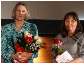
Prezentacja słuchowiska "Bombka z Memmingen" - Olsztyn, 9 stycznia 2023vvvv