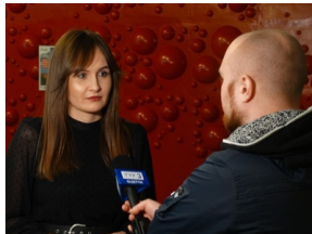
Prezentacja słuchowiska "Bombka z Memmingen" - Olsztyn, 9 stycznia 2023vvvv