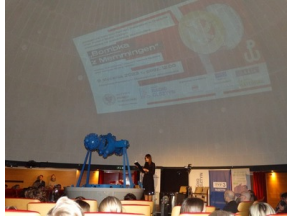
Prezentacja słuchowiska "Bombka z Memmingen" - Olsztyn, 9 stycznia 2023vvvv