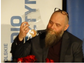
Prezentacja słuchowiska "Bombka z Memmingen" - Olsztyn, 9 stycznia 2023vvvv