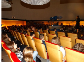
Prezentacja słuchowiska "Bombka z Memmingen" - Olsztyn, 9 stycznia 2023vvvv