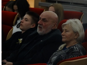
Prezentacja słuchowiska "Bombka z Memmingen" - Olsztyn, 9 stycznia 2023vvvv