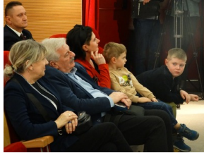
Prezentacja słuchowiska "Bombka z Memmingen" - Olsztyn, 9 stycznia 2023vvvv