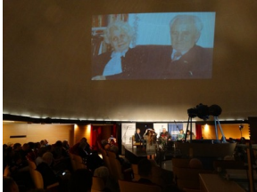
Prezentacja słuchowiska "Bombka z Memmingen" - Olsztyn, 9 stycznia 2023vvvv