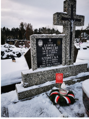
Oddanie hołdu zmarłym internowanym i represjonowanym podczas stanu wojennego - Białystok, 13 grudnia 2022