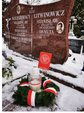
Oddanie hołdu zmarłym internowanym i represjonowanym podczas stanu wojennego - Białystok, 13 grudnia 2022