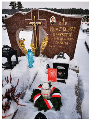
Oddanie hołdu zmarłym internowanym i represjonowanym podczas stanu wojennego - Białystok, 13 grudnia 2022