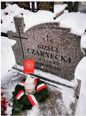
Oddanie hołdu zmarłym internowanym i represjonowanym podczas stanu wojennego - Białystok, 13 grudnia 2022