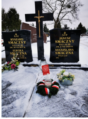
Oddanie hołdu zmarłym internowanym i represjonowanym podczas stanu wojennego - Białystok, 13 grudnia 2022