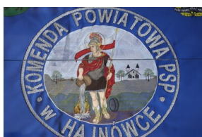
Podpisanie porozumienia o współpracy z Powiatową Komendą Państwowej Straży Pożarnej - Hajnówka, 6 grudnia 2022, Fot. Natalia Krzywicka