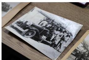
Podpisanie porozumienia o współpracy z Powiatową Komendą Państwowej Straży Pożarnej - Hajnówka, 6 grudnia 2022