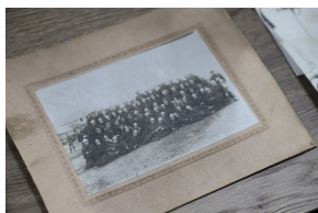
Podpisanie porozumienia o współpracy z Powiatową Komendą Państwowej Straży Pożarnej - Hajnówka, 6 grudnia 2022, Fot. Natalia Krzywicka