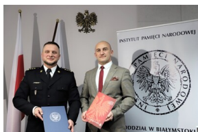
Podpisanie porozumienia o współpracy z Powiatową Komendą Państwowej Straży Pożarnej - Hajnówka, 6 grudnia 2022