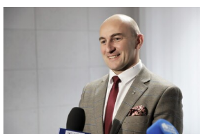
Podpisanie porozumienia o współpracy z Powiatową Komendą Państwowej Straży Pożarnej - Hajnówka, 6 grudnia 2022