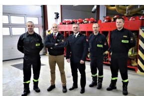
Podpisanie porozumienia o