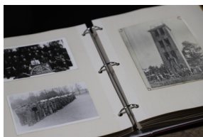
Podpisanie porozumienia o współpracy z Powiatową Komendą Państwowej Straży Pożarnej - Hajnówka, 6 grudnia 2022, Fot. Natalia Krzywicka