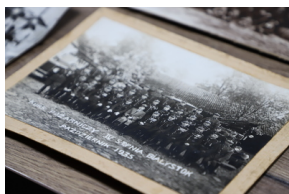
Podpisanie porozumienia o współpracy z Powiatową Komendą Państwowej Straży Pożarnej - Hajnówka, 6 grudnia 2022