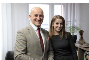
Podpisanie porozumienia o współpracy z Powiatową Komendą Państwowej Straży Pożarnej - Hajnówka, 6 grudnia 2022