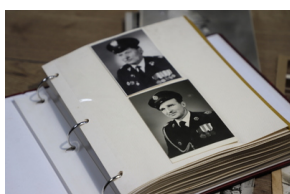
Podpisanie porozumienia o