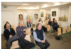
Przystanek historia pt. "Drogi do wolności" - Sokółka, 30 listopada 2022