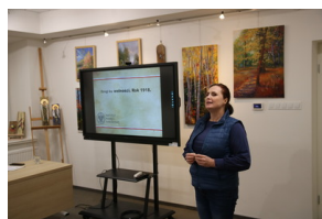
Przystanek historia pt. "Drogi do wolności" - Sokółka, 30 listopada 2022, Fot. Paweł Murawski IPN

Serdecznie dziękujemy za przybycie i zapraszamy na kolejne spotkania!