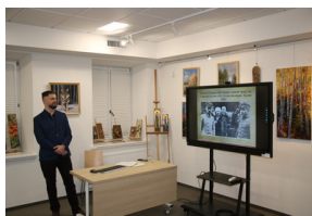
Przystanek historia pt. "Drogi do wolności" - Sokółka, 30 listopada 2022, Fot. Paweł Murawski IPN