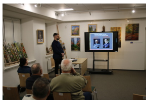
Przystanek historia pt. "Drogi do wolności" - Sokółka, 30 listopada 2022