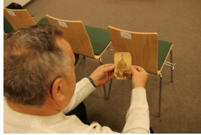
Przystanek historia, pt. "Drogi do wolności" - Sokółka, 30 listopada 2022, Fot. Paweł Murawski IPN