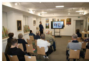
Przystanek historia pt. "Drogi do wolności" - Sokółka, 30 listopada 2022