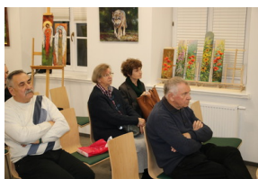
Przystanek historia pt. "Drogi do wolności" - Sokółka, 30 listopada 2022