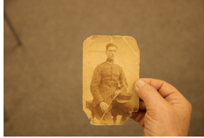
Przystanek historia, pt. "Drogi do wolności" - Sokółka, 30 listopada 2022