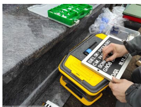
Bielsk Podlaski: Poszukiwania szczątków ofiar terroru komunistycznego