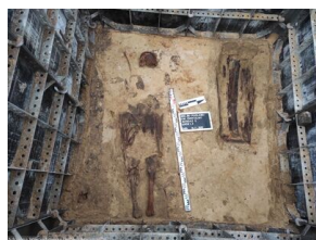
Bielsk Podlaski: Poszukiwania szczątków ofiar terroru komunistycznego