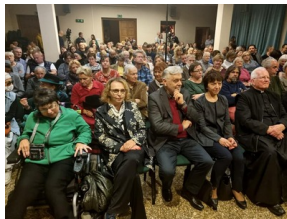
Warszawskie obchody 38. rocznicy męczeńskiej śmierci bł. ks. Jerzego Popiełuszki - Warszawa, 16,19 października 2022, Fot. Urszula Gierasimiuk