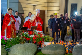
Warszawskie obchody 38. rocznicy męczeńskiej śmierci bł. ks. Jerzego Popiełuszki - Warszawa, 16,19 października 2022