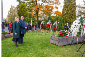
Warszawskie obchody 38. rocznicy męczeńskiej śmierci bł. ks. Jerzego Popiełuszki - Warszawa, 16,19 października 2022