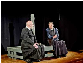
Warszawskie obchody 38. rocznicy męczeńskiej śmierci bł. ks. Jerzego Popiełuszki - Warszawa, 16,19 października 2022