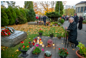
Warszawskie obchody 38. rocznicy męczeńskiej śmierci bł. ks. Jerzego Popiełuszki - Warszawa, 16,19 października 2022, Fot. Adam Szymański