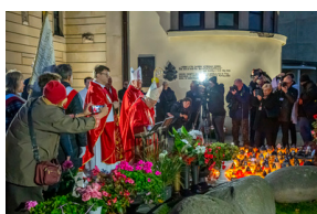
Warszawskie obchody 38. rocznicy męczeńskiej śmierci bł. ks. Jerzego Popiełuszki - Warszawa, 16,19 października 2022, Fot.