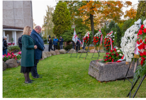
Warszawskie obchody 38. rocznicy męczeńskiej śmierci bł. ks. Jerzego Popiełuszki - Warszawa, 16,19 października 2022