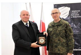
Podpisanie porozumienia o współpracy między