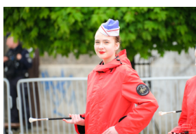
„Ile wyjazdów, tyle powrotów. Rzecz o straży pożarnej” - prezentacja wystawy białostockiego IPN podczas Wojewódzkich Obchodów Dnia Strażaka - Białystok, 27 maja 2022