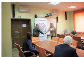
Przystanek Historia - Hajnówka, 20 maja