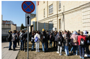
Gra miejska „Szlakiem Polski Walczącej”

Dziękujemy wszystkim za udział w grze i do zobaczenia w przyszłości!