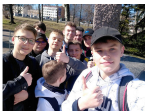
Gra miejska „Szlakiem Polski Walczącej”, Fot. IPN OBEN Białystok