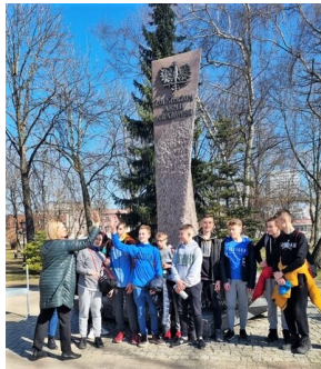
Gra miejska „Szlakiem Polski Walczącej”