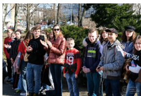
Gra miejska „Szlakiem Polski Walczącej”, Fot. IPN OBEN Białystok