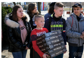
Gra miejska „Szlakiem Polski Walczącej”, Fot. IPN OBEN Białystok