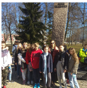
Gra miejska „Szlakiem Polski Walczącej”