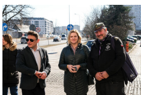
Gra miejska „Szlakiem Polski Walczącej”