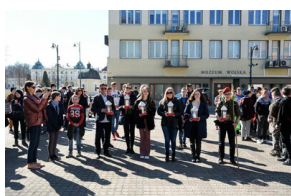
Gra miejska „Szlakiem Polski Walczącej”