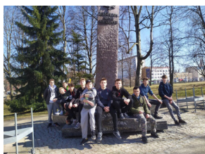
Gra miejska „Szlakiem Polski Walczącej”