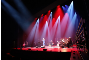
Widowisko muzyczne w Operze i Filharmonii Podlaskiej "I że Was nie zapomnę..." poświęcone Żołnierzom Wykietym, Fot. IPN Natalia Krzywicka