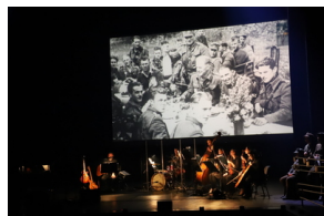
Widowisko muzyczne w Operze i Filharmonii Podlaskiej "I że Was nie zapomnę..." poświęcone Żołnierzom Wyklętym