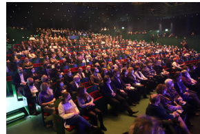
Widowisko muzyczne w Operze i Filharmonii Podlaskiej "I że Was nie zapomnę..." poświęcone Żołnierzom Wykietym