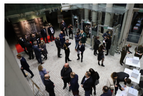
Widowisko muzyczne w Operze i Filharmonii Podlaskiej "I że Was nie zapomnę..." poświęcone Żołnierzom Wykietym, Fot. IPN Natalia Krzywicka