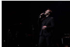
Widowisko muzyczne w Operze i Filharmonii Podlaskiej "I że Was nie zapomnę..." poświęcone Żołnierzom Wykietym