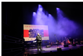
Widowisko muzyczne w Operze i Filharmonii Podlaskiej "I że Was nie zapomnę..." poświęcone Żołnierzom Wyklętym