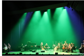
Widowisko muzyczne w Operze i Filharmonii Podlaskiej "I że Was nie zapomnę..." poświęcone Żołnierzom Wykietym, Fot. IPN Natalia Krzywicka