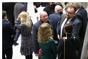
Widowisko muzyczne w Operze i Filharmonii Podlaskiej "I że Was nie zapomnę..." poświęcone Żołnierzom Wykietym