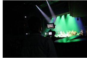
Widowisko muzyczne w Operze i Filharmonii Podlaskiej "I że Was nie zapomnę..." poświęcone Żołnierzom Wykietym