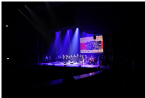
Widowisko muzyczne w Operze i Filharmonii Podlaskiej "I że Was nie zapomnę..." poświęcone Żołnierzom Wykietym