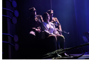
Widowisko muzyczne w Operze i Filharmonii Podlaskiej "I że Was nie zapomnę..." poświęcone Żołnierzom Wykietym