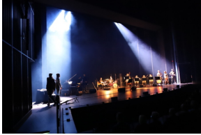
Widowisko muzyczne w Operze i Filharmonii Podlaskiej "I że Was nie zapomnę..." poświęcone Żołnierzom Wykietym, Fot. IPN Natalia Krzywicka