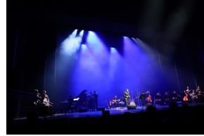
Widowisko muzyczne w Operze i Filharmonii Podlaskiej "I że Was nie zapomnę..." poświęcone Żołnierzom Wykietym