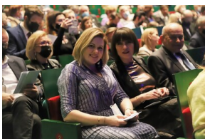
Widowisko muzyczne w Operze i Filharmonii Podlaskiej "I że Was nie zapomnę..." poświęcone Żołnierzom Wykietym