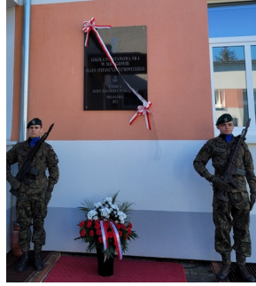
Wojewódzkie obchody Narodowego Dnia Pamięci Żołnierzy Wyklętych