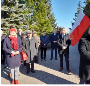
Wojewódzkie obchody Narodowego Dnia Pamięci Żołnierzy Wyklętych