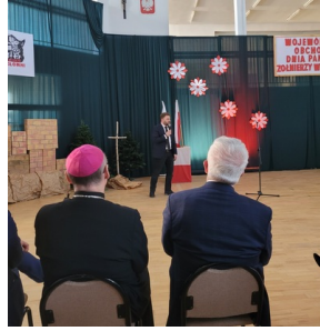
Wojewódzkie obchody Narodowego Dnia Pamięci Żołnierzy Wyklętych