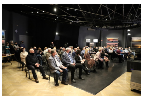
Promocja wyboru dokumentów „Rok pierwszy. Urząd Bezpieczeństwa Publicznego w województwie białostockim (sierpień 1944 - lipiec 1945)”.