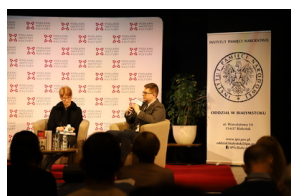
Promocja wyboru dokumentów „Rok pierwszy. Urząd Bezpieczeństwa Publicznego w województwie białostockim (sierpień 1944 - lipiec 1945)”.