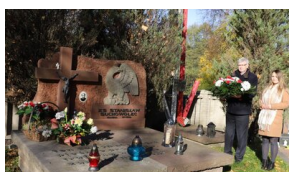
Narodowy Dzień Pamięci Duchownych Niezłomnych i 37. rocznica śmierci bł. ks. Jerzego Popiełuszki.