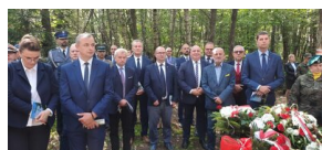
Obchody 77. rocznicy bitwy 9. Pułku Strzelców Konnych z Niemcami.