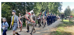
Obchody 77. rocznicy bitwy 9. Pułku Strzelców Konnych z Niemcami.

Prelegenci w przemówieniach przedstawili zarys i wartość stoczonych bitwy nie tylko ze względu na czyny i poświęcenie polskich żołnierzy, ale również ze względu na leśników oraz ludność cywilną, którzy 8 września 1944 r. ponieśli okrutną śmierć z rąk niemieckiego okupanta. Na koniec uroczystych obchodów uczestnicy złożyli kwiaty i zapalili znicze.