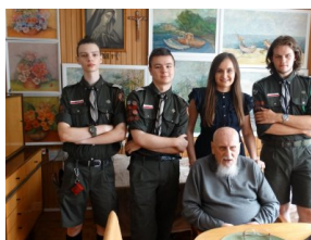
Obchody 77. rocznicy wybuchu Powstania Warszawskiego.