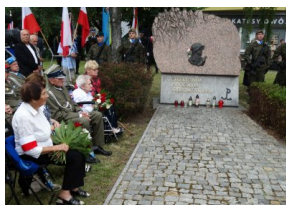
Obchody 77. rocznicy wybuchu Powstania Warszawskiego.