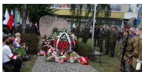
Obchody 77. rocznicy wybuchu Powstania Warszawskiego.