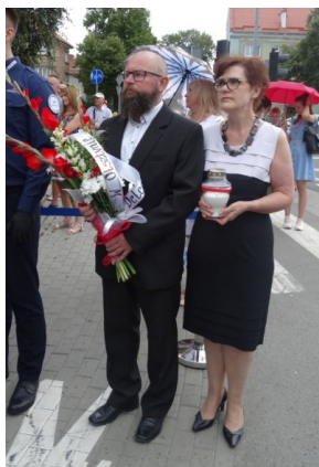
Obchody 77. rocznicy wybuchu Powstania Warszawskiego.