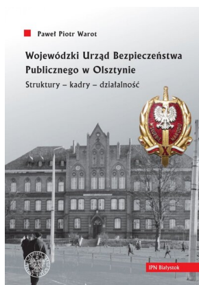
Promocja książki „Wojewódzki Urząd Bezpieczeństwa Publicznego w Olsztynie. Struktury-kadry-działalność 1945-1956”.