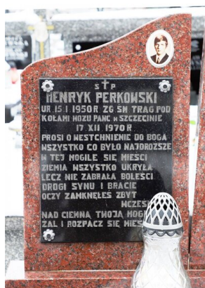
Upamiętnienie ofiary szczecińskiego grudnia `70