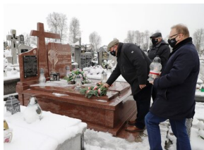
Upamiętnienie ofiary szczecińskiego grudnia `70