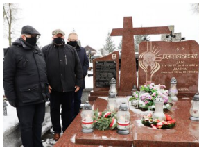
Upamiętnienie ofiary szczecińskiego grudnia `70, fot. A. Piekarska IPN