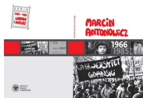
35. rocznica śmierci Marcina Antonowicza