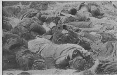
Wzięci do niewoli, rozstrzani i wycięci szablami we wsi Lemnau'e ziemi łomżyńskiej pow. kolneńskiego: 1 oficer 69 p. p., 37 żołnierzy i 5 cywilnych z II-go baonu Kowieńskiego p. p. dnia 25-go lipca 1920 roku. Pochowani zostali przez ludność m. Kolna.

Odradzająca się w ogniu wojen lat 1918-1921 Rzeczpospolita Polska nie była stroną konwencji haskiej z 1907 r., regulującej kwestie jeńców wojennych, jednak uznawała jej postanowienia. Odnosiło się to także do wojny polsko-bolszewickiej, która rozpoczęła się de facto 4 stycznia 1919 r. w okolicach Wilna, a zakończyła de iure traktatem pokojowym zawartym 18 marca 1921 r. w Rydze. Kończąc wojnę, obie strony w układzie o repatriacji z 24 lutego 1921 r. uznały, że status jeńców mają też wszystkie osoby, które służyły w polskich formacjach zbrojnych walczących z bolszewikami na terenie Rosji w latach 1917-1920.