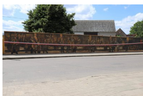
Odsłonięcie muralu upamiętniającego deportacje Polaków