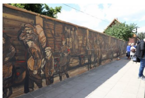
Odsłonięcie muralu upamiętniającego deportacje Polaków