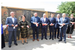
Odsłonięcie muralu upamiętniającego deportacje Polaków, fot. A. Piekarska