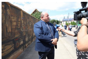
Odsłonięcie muralu upamiętniającego deportacje Polaków, fot. A. Piekarska