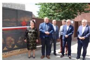
Odsłonięcie muralu upamiętniającego deportacje Polaków