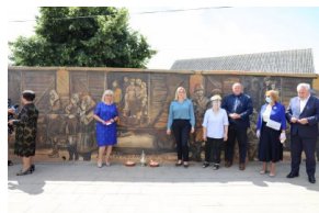
Odsłonięcie muralu upamiętniającego deportacje Polaków