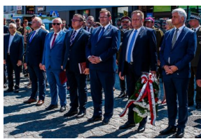
Odsłonięcie tablicy poświęconej 4 Pułkowi Ułanów Zaniemeńskich