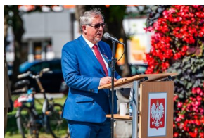
Odsłonięcie tablicy poświęconej 4 Pułkowi Ułanów Zaniemeńskich