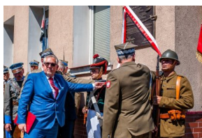
Odsłonięcie tablicy poświęconej 4 Pułkowi Ułanów Zaniemeńskich