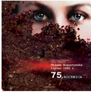
Wydawnictwo rocznicowe „Obława Augustowska lipiec 1945 r.”