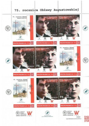
Znaczki okolicznościowe z okazji 75. rocznicy Obławy Augustowskiej