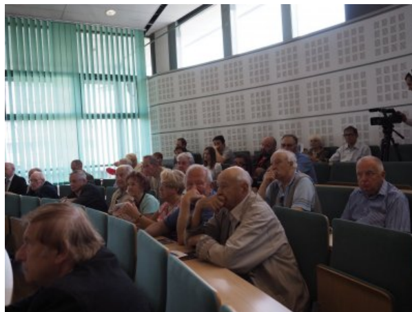
Goście spotkania zebrani w Książnicy Podlaskiej