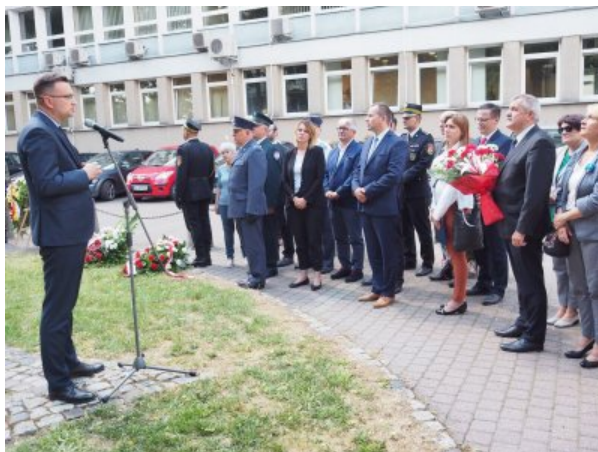
Do uczestników uroczystości przemówił Rafał Rudnicki, wiceprezydent Białegostoku

http://www.dzieje.pl/aktualnosci/w-bialymstoku-wyklady-nt-sytuacji-zydow-w-regionie-w-tym