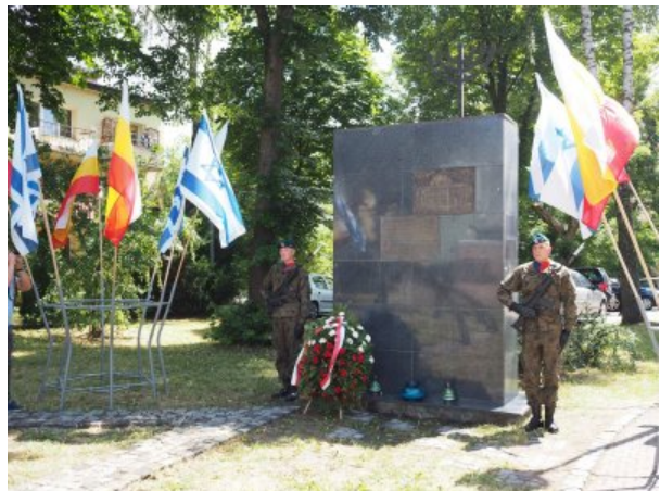
Pomnik Ofiar spalonych przez Niemców w Wielkiej Synagodze