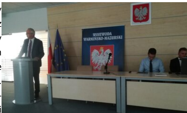
Wystąpienie warmińsko-mazurskiego kuratora oświaty Krzysztofa Nowackiego

Informacje w mediach: http://olsztyn.tvp.pl/37116940/8518-godz-1830 (od 5:06 min.).