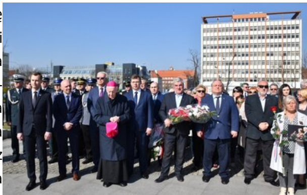
Uczestnicy obchodów 8. rocznicy Katastrofy Smoleńskiej.