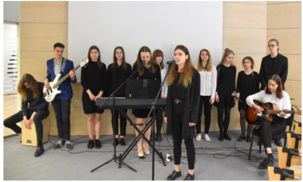
Część artystyczna.