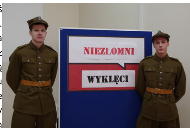
Uczniowie w partyzanckich mundurach