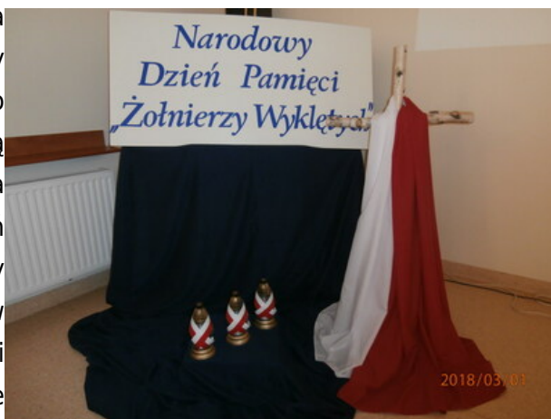
Narodowy Dzień Pamięci „Żołnierzy Wyklętych” w Zespole Szkół Technicznych i Ogólnokształcących Nr 4