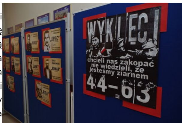
Ekspozycja o Żołnierzach Wyklętych