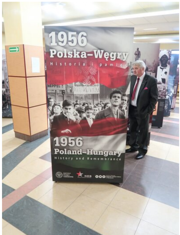
Prezentacja wystawy IPN