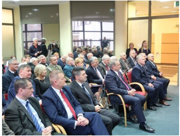
Konferencja w Podlaskim Urzędzie Wojewódzkim