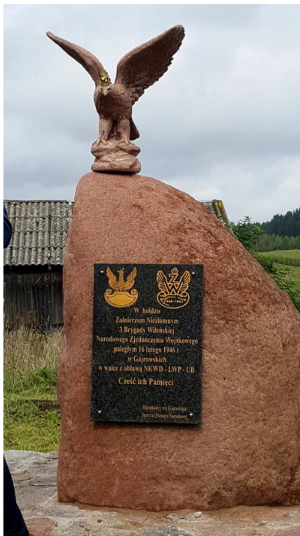
„Dni Pamięci agresji ZSRR na Polskę” - Gajrowskie