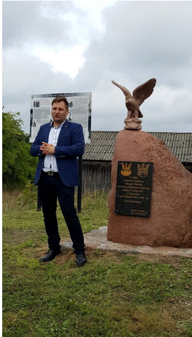
„Dni Pamięci agresji ZSRR na Polskę” - Gajrowskie