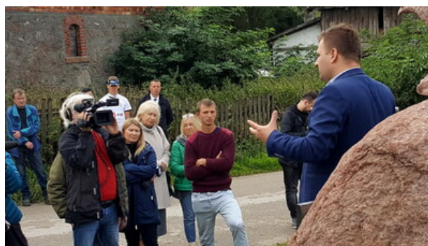
„Dni Pamięci agresji ZSRR na Polskę” - Gajrowskie