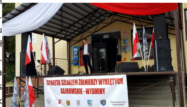
„Dni Pamięci agresji ZSRR na Polskę” - Gajrowskie