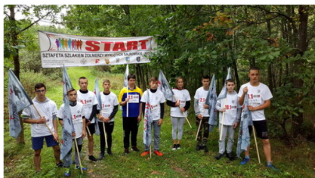
„Dni Pamięci agresji ZSRR na Polskę” - Gajrowskie