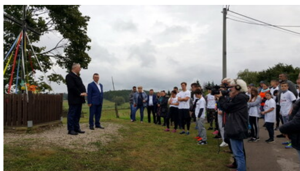
„Dni Pamięci agresji ZSRR na Polskę” - Gajrowskie