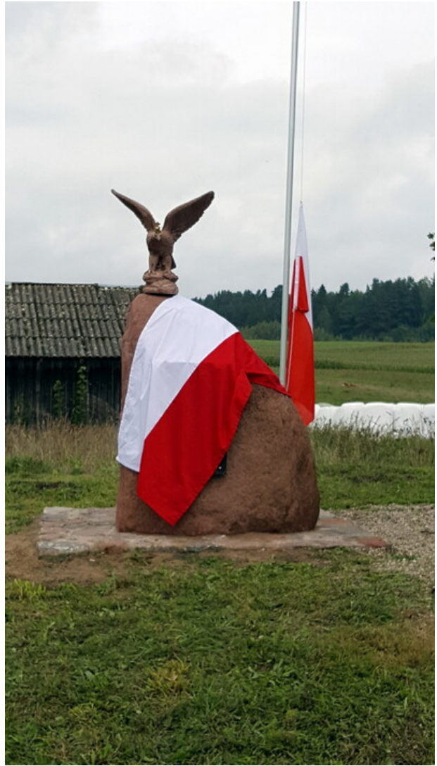
„Dni Pamięci agresji ZSRR na Polskę” - Gajrowskie