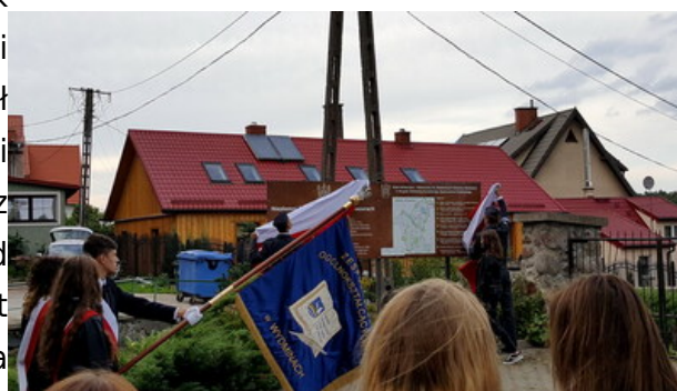
„Dni Pamięci agresji ZSRR na Polskę” - Gajrowskie